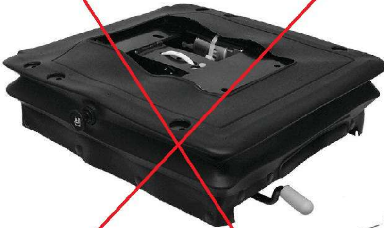
KAB 25 PNEUMATIQUE