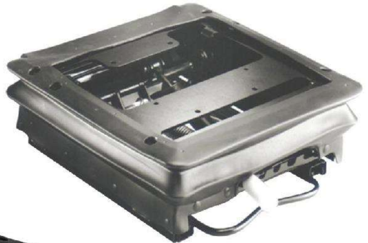
KAB 21 MECANIQUE